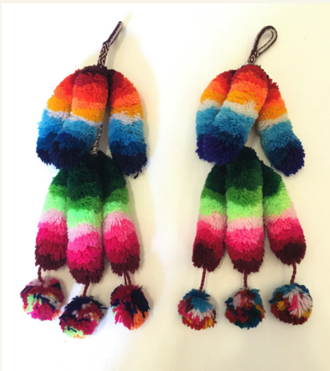
Imagen de referencia Culebrilla

LÁMINAS COLOREABLES Fundación Artesanías de Chile