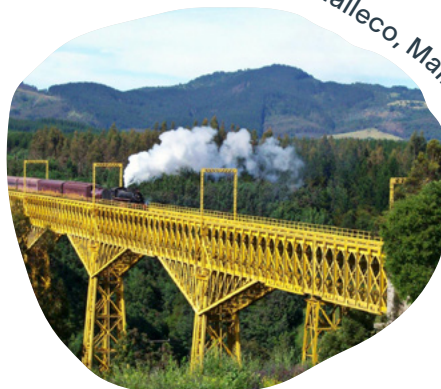
Viaducto del Malleco, Malleco