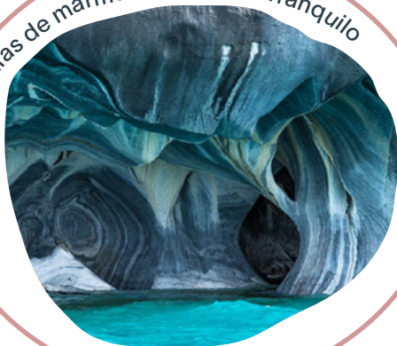
Capillas de mármol, Puerto Río Tranquilo