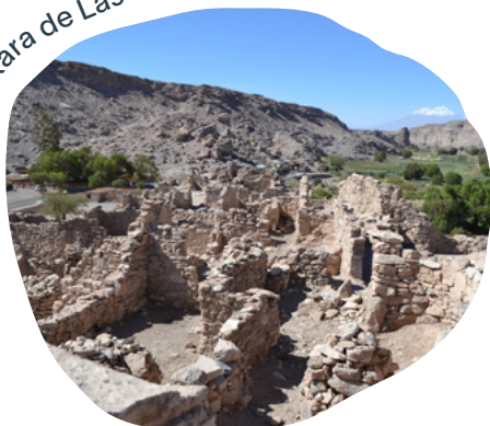
Pukara de Lasana, Calama