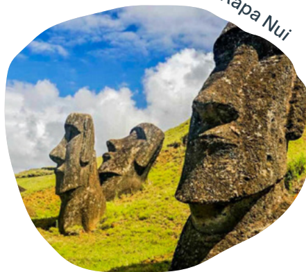
Moai, Rapa Nui