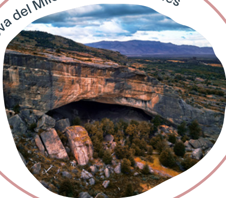
Cueva del Milodón, Puerto Natales