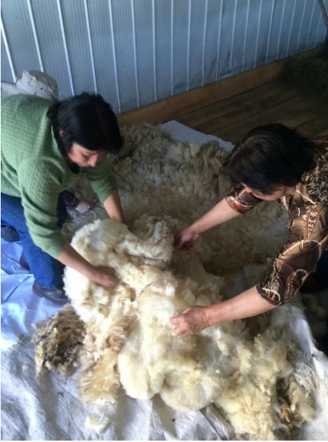
Proceso de Selección de Vellones