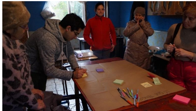
Taller economía solidaria y asociatividad grupo Cochamó. Agosto 2018.