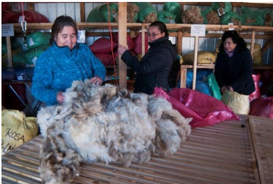
Compra de vellón por artesanas en centro de acopio y venta Lenca