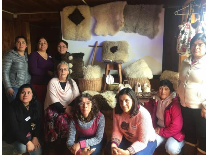
Taller venta conjunta Hualaihué, septiembre 2018.