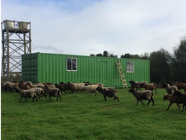
Centro de acopio Butalcura

*Se adjunta más información en ANEXO 6_Banco de Lanas_En busca de un modelo innovador.